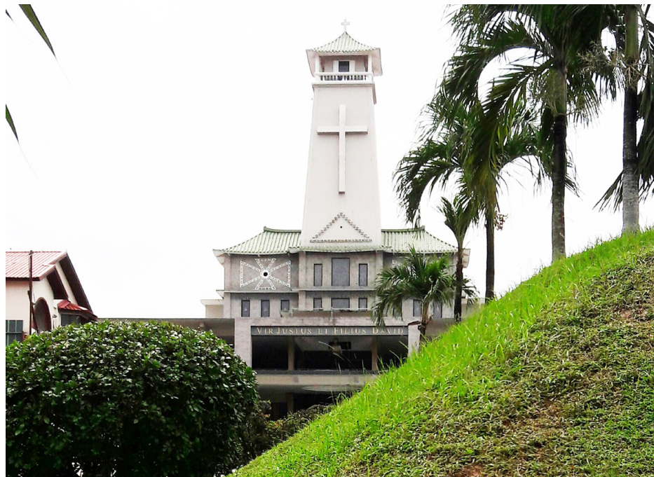
武吉知马圣若瑟堂，山上的城，山上的光！