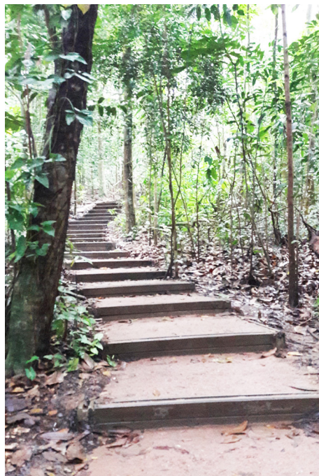
林中台阶，亦通往武吉知马山。