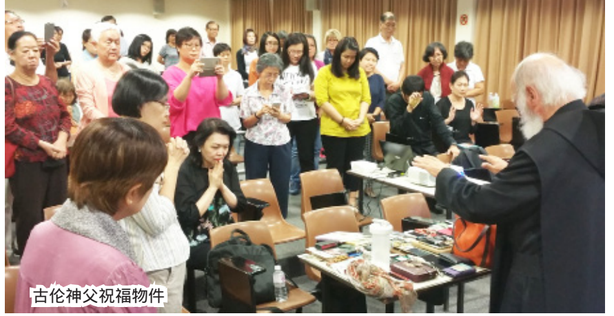
古伦神父祝福物件

德国灵修大师古伦神父第三次来新加坡，从8月26日至31日马不停蹄在天主教教育中心、圣亚纳堂、和平之后堂、复活堂和圣十字架堂给灵修讲座，其中8月28日在卫理公会给牧者主办退修日。今年的灵修讲座和往年不同，重点是从个人到团体，家庭到教会，青年到老年，负面到正面，破碎到治愈。