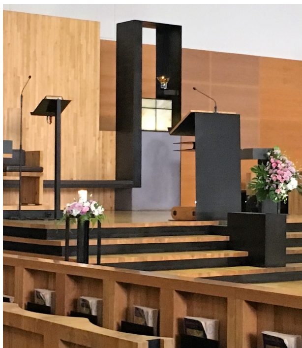
天使之后堂里设计简约的圣体柜与常明灯

后来我竟然真的“看见”基督在圣体的临在。这事不可思议，缘起于另一件我之前绝无法预料的事。在入教一年后，堂区一位非常务送圣体员竟有意邀请我加入非常务送圣体员组织。我的第一个反应是：“我是个罪人，且教龄甚浅，如何担负这项任务！”他立刻回应：“世上有谁不是罪人呢！教龄长短不成问题，最主要是内心有没有服务