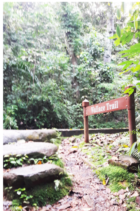
华莱士小径，生物物种丰富。

圣 若瑟堂附近的牛乳场自然公园，是大自然爱好者寻幽探秘的好地方。它处在武吉知马自然保护区内，环境清幽、野趣十足。它的另一特色是保留矿湖湿地原貌，是飞鸟与各类昆虫的栖息地，且风景宜人。徒步在这鸟语花香、蝉声不断的绿林里，如同置身世外桃园中。